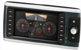
UNIVERSELL BEDIEN- UND ANZEIGEEINHEIT